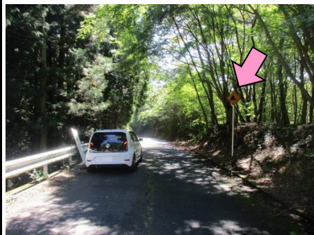
16図 右手の「落石注意」標識