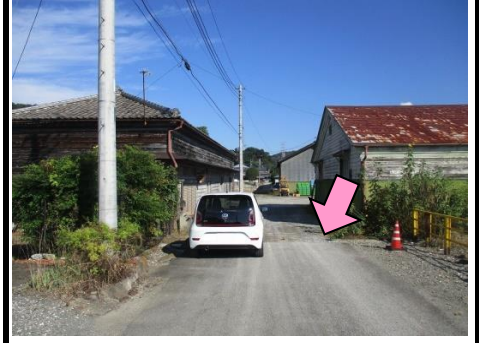
30図 舗装とダートの境目