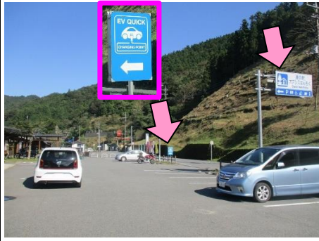
27図 『道の駅 オアシスなんもく』 右手の看板