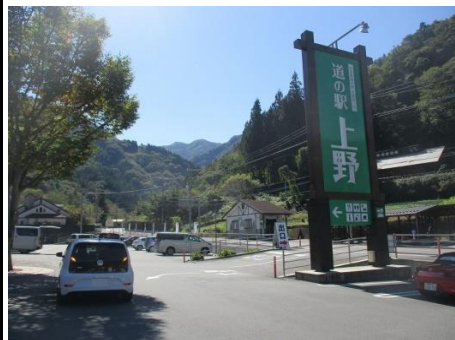
20図 『道の駅 上野』 右手の看板