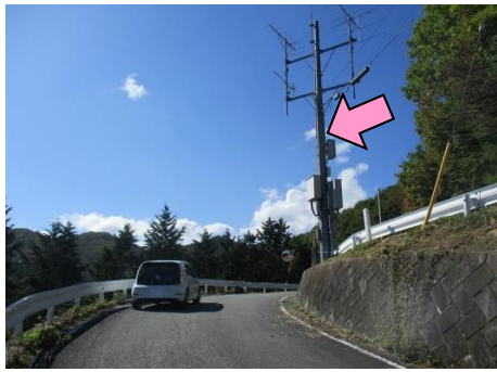
23図先 右手のアンテナ