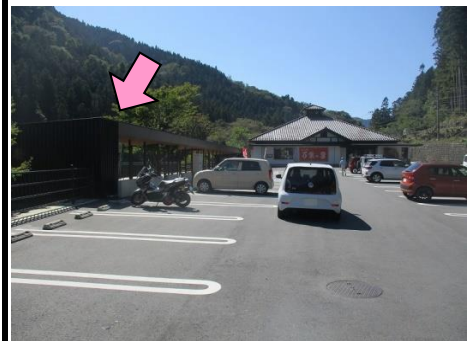
18図 『道の駅 万葉の里』 左手のテラス手前端