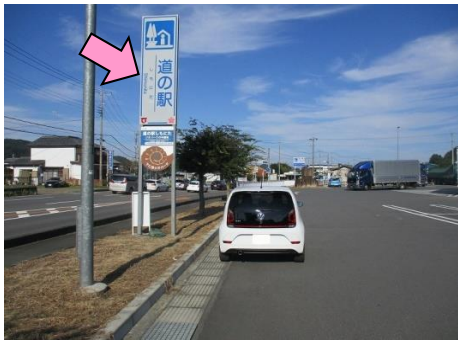
31図 『道の駅 しもにた』駐車場 左手の看板