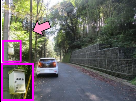
5図 左手の電柱(大沢218) 手前に「高崎市」と書かれた BOXあり ここまで、 7.689km