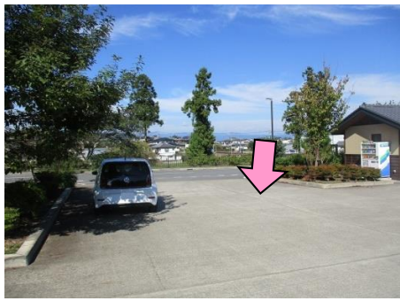
1図 『道の駅甘楽(小幡公園)』 駐車場出口 路面の継ぎ目 (トイレ横の植込みの縁石の延長線)