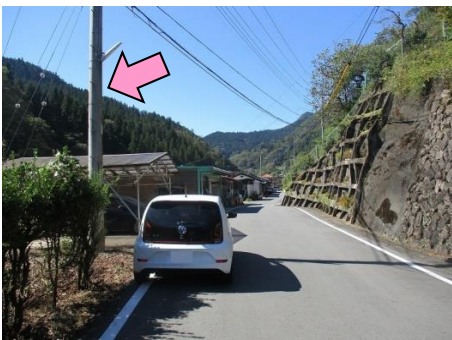
19図 左手の電柱 右手に「岩崎竹松翁の功德碑」 への急階段あり