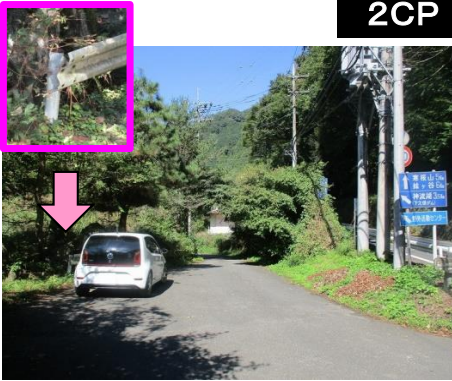
14図 左手のガードレール手 前端