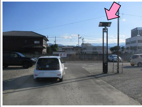
31図 『富岡製糸場無料駐車場』 右手の外灯