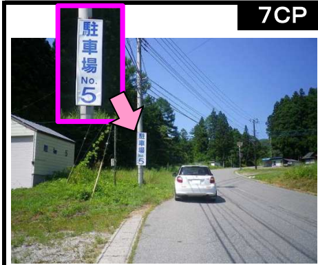
30図 『川場スキー場』第五駐車場前 左手の案内看板