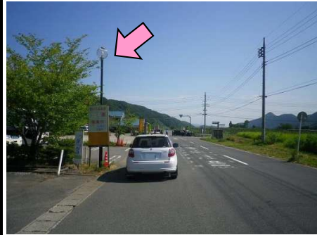
33図 『サラダパークぬまた』前 左手の外灯