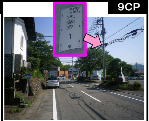
37図 『JA薄根支所(産直所やさいの杜)』前 右手の電柱(大釜支1)