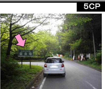
23図以降、最初に出てくる標識