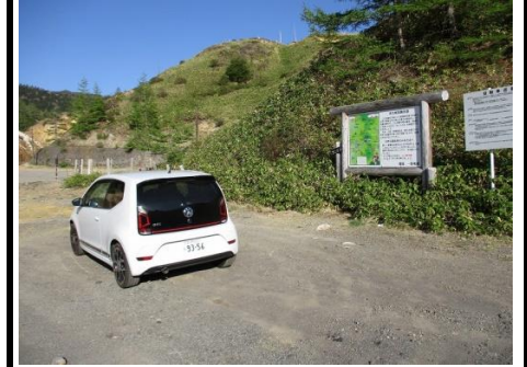
43図 『万座しぜん情報館(空吹)』 右手の案内板 前方の脚