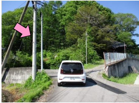
29図 『円通殿』 左手の電柱 ※速やかに前方の駐車スペースに移動のこと。 再スタートは、30図