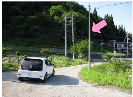
37図 『中居屋重兵衛の墓』 右手の電柱