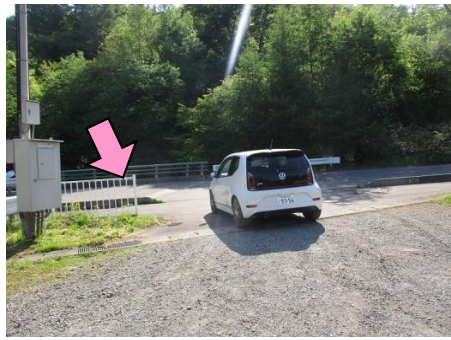
30図 『干俣親水公園』駐車場 出口 左手のフェンス