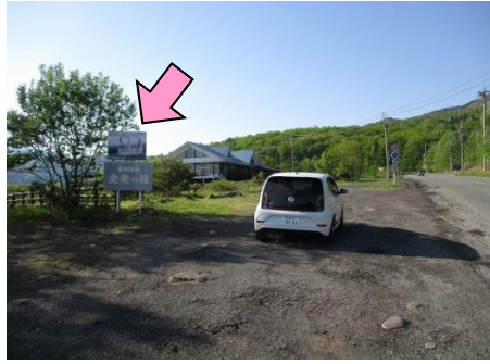
41図 『孀恋牧場 愛妻の鐘』 左手の看板 路面に大きめの石が出ている ので注意