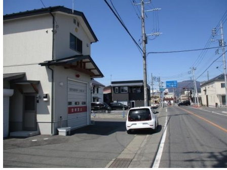
27図 「沼田市消防団第1分団第2部」建物の前端